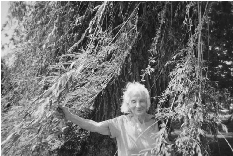
Photo tirée du diptyque « Un portrait inachevé (partition à deux voix) », de l'artiste Sophie Jodoin, présenté à Percé. PHOTO : Sophie Jodoin

renfoussances du passé. Un travail a été jamais fini totalement, dans la breche d'une relation qui évolue sans cesse.