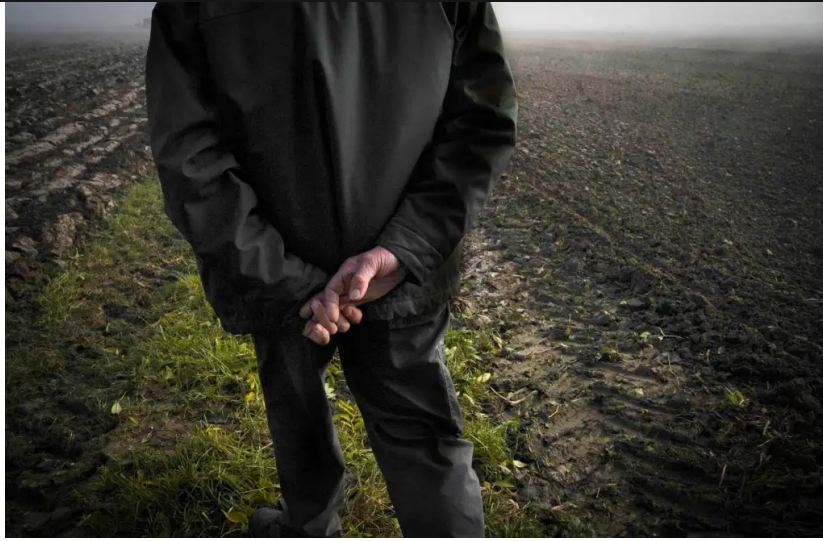
Dans tes pas